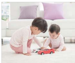
Bebés y mayores con sistemas autoinmunes débiles