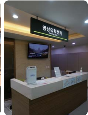
En la sala de Espera