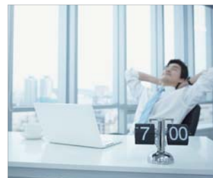
Para aquellos que pasan muchas horas de exposición en hospitales y escuelas