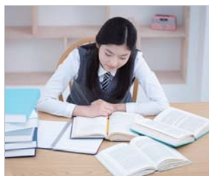
Estudiantes que necesitan de cuidados especiales de salud