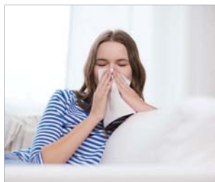
Aquellos que sufren de dermatitis atópica, asma o todo tipo de alergias