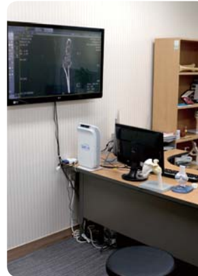
En la Oficina del Doctor