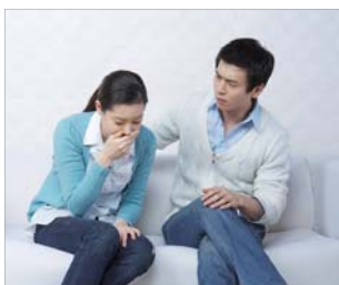
Aquellos que sufren de síndrome de "edificio enfermo"