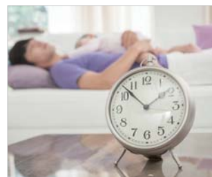
Aquellos que desean disponer de un aire purificado 24/7 sin preocuparse de riesgos