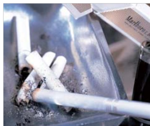
Aquellos que sufren con los malos olores de tabaco y comida